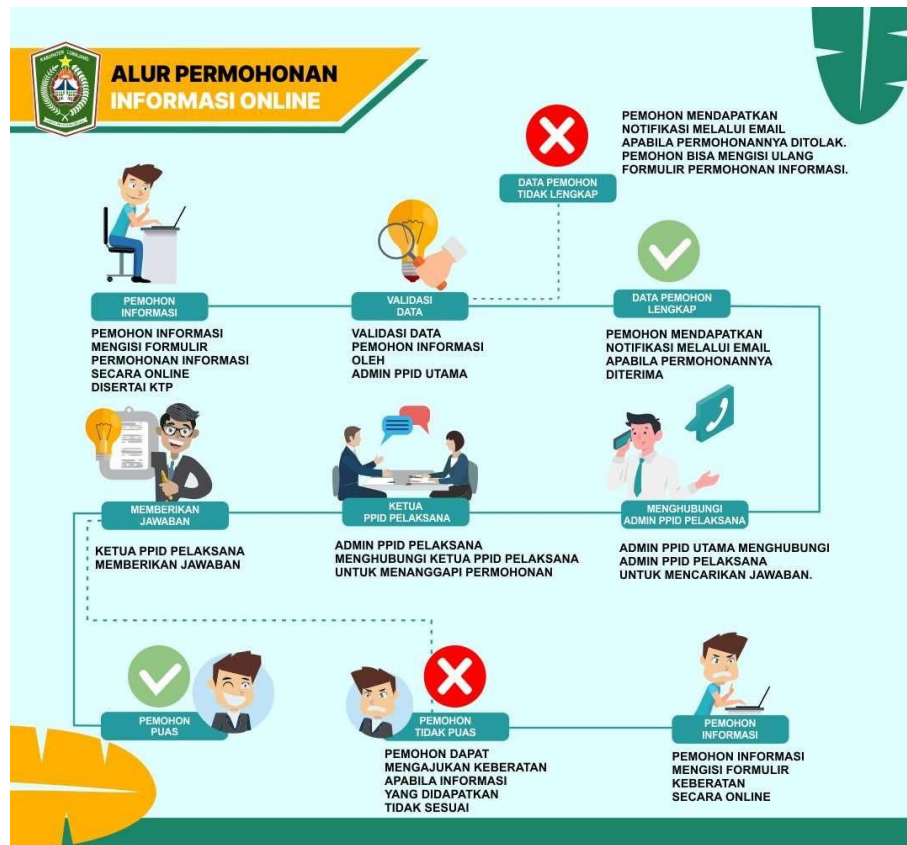
Gambar: 2.2 Alur Permintaan Informasi PPID Universitas Hasanuddin Tahun 2025