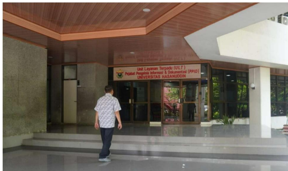
Gambar. 2.1. Suasana di dalam ruangan PPID Unhas (atas); Halaman depan pintu masuk kantor PPID Unhas (bawah)